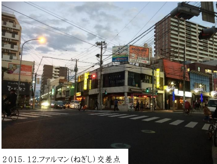
2015.12.ファルマン(ねぎし)交差点