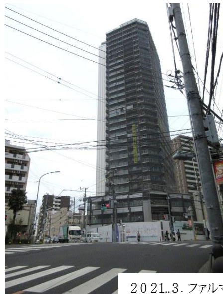
2021.3.ファルマン交差点