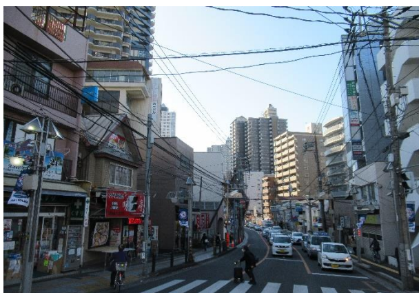
平成時代ファルマン交差点から銀座商店街方面を望む

高層ビル街へと変貌した中心市街地はかつては個人営業の商店が立ち並ぶ商店街でした。明治時代から各商店街の今昔を貴重な写真でふり返ります。