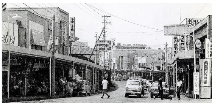
昭和40年代ファルマン交差点から銀座商店街方面を望む