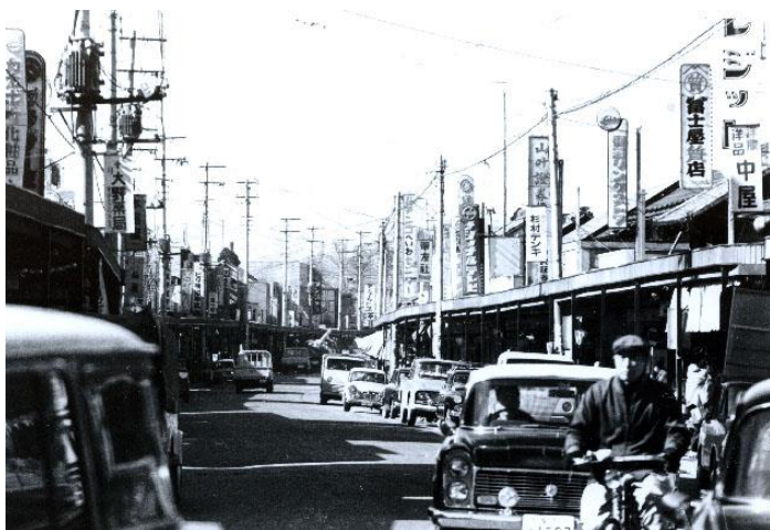
昭和39年頃銀座商店街(寿町界隈)