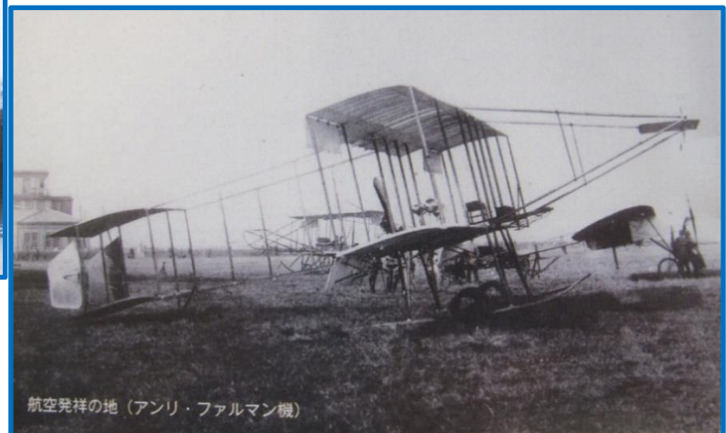
航空発祥の地(アンリ・ファルマン機)