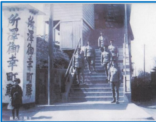
左：昭和15年、所澤御幸町駅 下：アンリファルマン機

日本初の飛行場、所澤飛行場で初めてアンリファルマン機が空に羽ばたいたのが 1911年4月5日。この日を記念して、毎年この時期に開催してまいりました「所澤飛行場ものがたり」を、今年も下記の日程で開催いたします。かつてここ所沢に日本初の飛行場が造られ、来日したフォール大佐はじめフランスからの教育団が所沢を訪れ、町中も大いに賑わいを見せた当時の様子を、写真と解説図、解説文にてご紹介いたします。