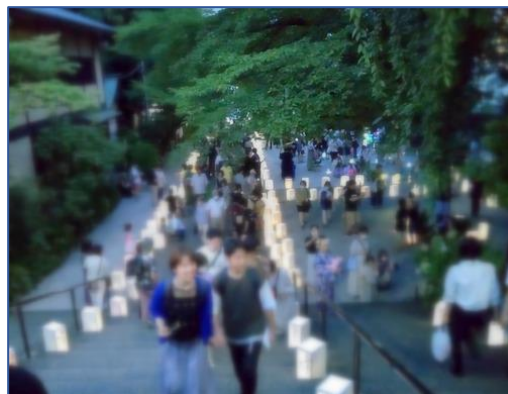
昨年の所澤神明社の様子