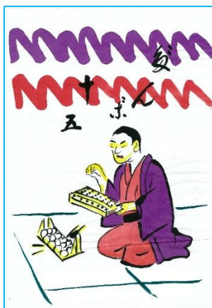
元句：三五 十五 だじゃれ句：団子 十五