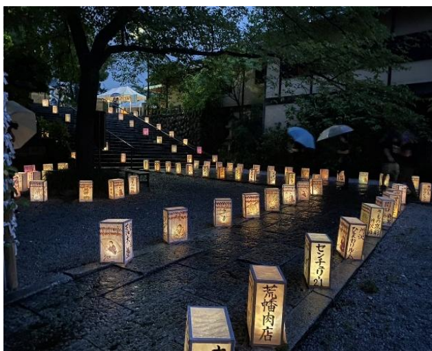
所澤神明社の地口行灯展示の様子