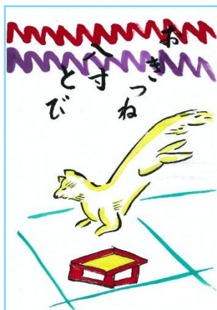
元句：義経八双飛び だじゃれ句：お狐八寸飛び